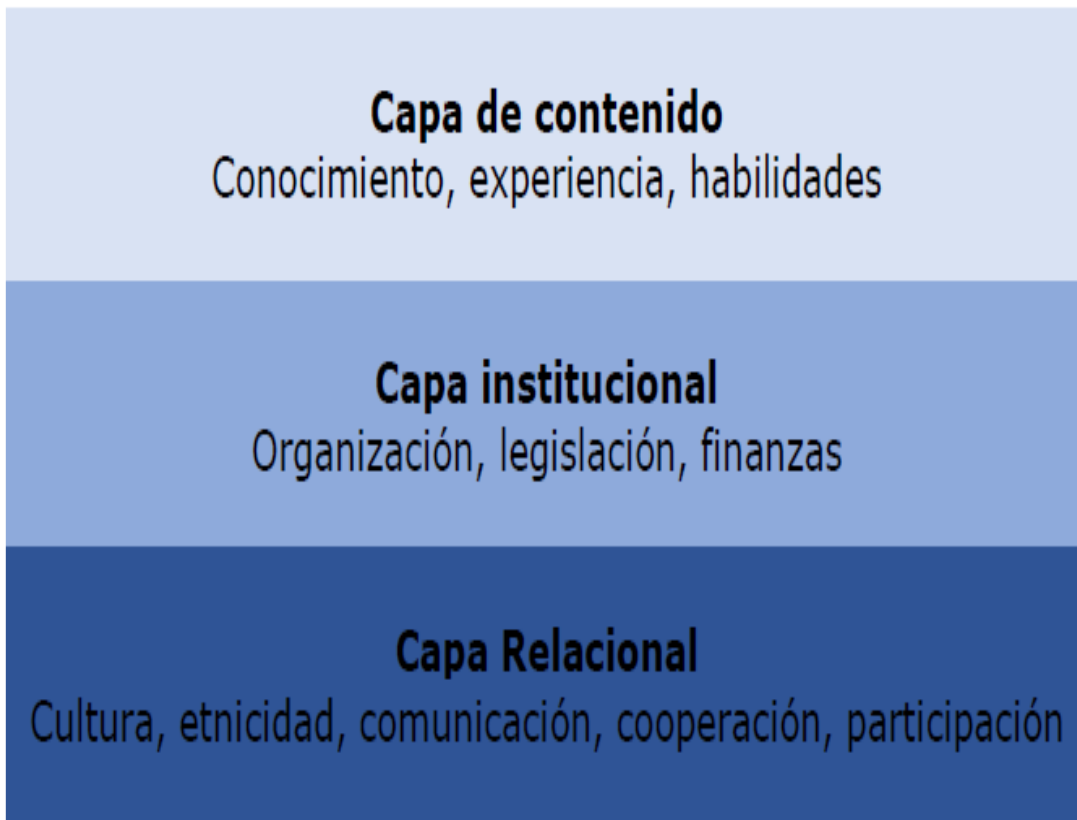
Los tres niveles de Gobernanza del Agua

Como resultado se ha planteado una Hoja de Ruta hacia la reducción del riesgo de inundaciones. Los retos relacionados con el sistema hídrico de la Ciudad de Panamá incluyen riesgos de inundaciones (precipitación, desbordamiento de ríos y elevación del nivel del mar), falta de agua (disponibilidad insuficiente para responder a la creciente demanda) y calidad del agua (vertido de aguas no tratadas provenientes de actividades industriales, agrícolas y hogares).