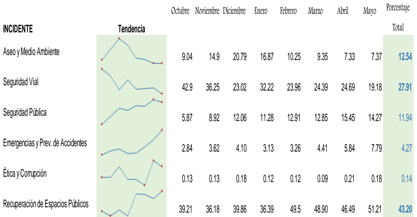
GRÁFICO 1. PORCENTAJE DE INCIDENCIAS EN EL DISTRITO DE PANAMÁ, SEGÚN TIPO, POR MES DE OCURRENCIA: OCTUBRE 2017-MAYO 2018