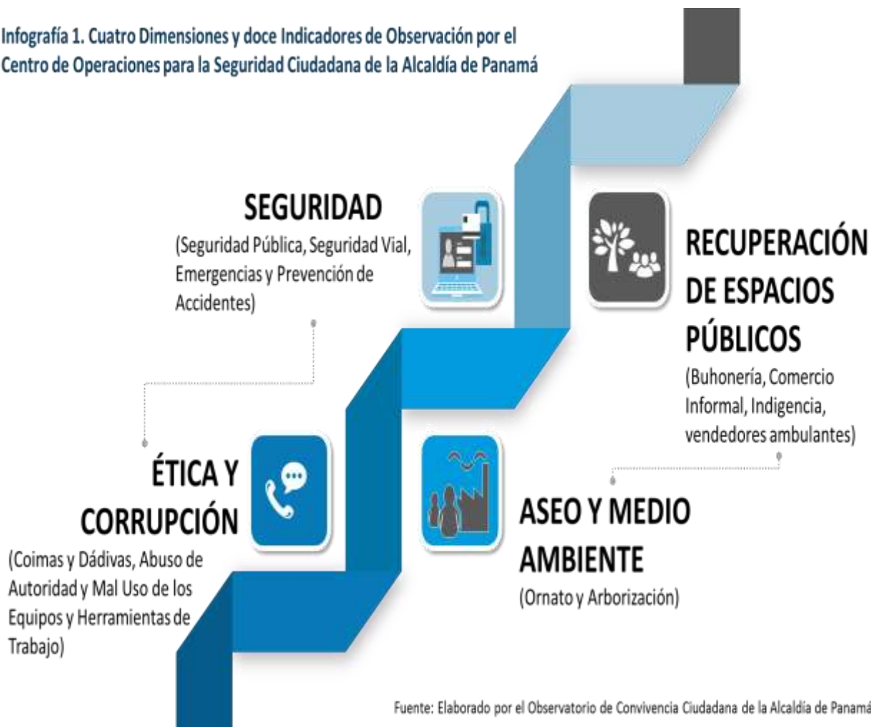
Infografía 1. Cuatro Dimensiones y doce Indicadores de Observación por el Centro de Operaciones para la Seguridad Ciudadana de la Alcaldía de Panamá

En la tabla siguiente, se observa los corregimientos con mayores incidencias desde que empezó a funcionar el COSC, en octubre del 2017. De acuerdo con la tabla, Calidonia con 28.11%, Santa Ana 23.71% y 12.01% para Bella Vista, quienes presentan las ocurrencias más altas para los meses analizados. Luego tenemos el gráfico n°1, que muestra el porcentaje de incidencias en el distrito de Panamá, según tipo, por mes de ocurrencia y este, nos indica que el hecho de Recuperación