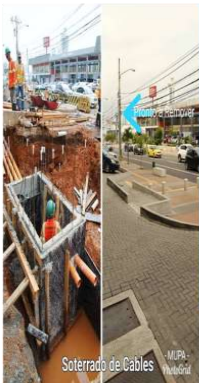
Soterrado de Cables - MUPA - PhotoGrid

Capacidad de los individuos, comunidades, instituciones, empresas y sistemas que se encuentran dentro de una ciudad para sobrevivir, adaptarse y crecer indistintamente de los impactos o tensiones que acontecen en su entorno. (100 Ciudades Resilientes)