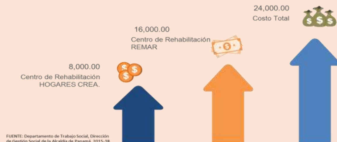
Costo Mensual de Rehabilitación de las Personas en Situación de Calle por la Alcaldía de Panamá