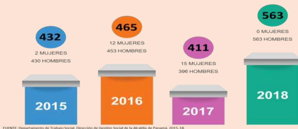
PERSONAS EN SITUACIÓN DE CALLE QUE INGRESAN A LOS CENTROS DE REHABILITACIÓN, AÑO: 2015-2018

En la edición N°9 junio 2018, de este Boletín Mensual, hacíamos referencia que las personas en Situación de Calle eran sólo hombres. Esto de acuerdo al Centro de Operaciones para la Seguridad Ciudadana (Video Vigilancia). Pero que igualmente, lo sostiene la Dirección de Gestión Social a través del Depto. De Trabajo Social en el cual, para el 2017, el 3.6% fueron mujeres y 96.4% hombres en situación de calle, que cambió al 100% hombres para el 2018. La diferencia en los costos de los centros de Rehabilitación es debido a que una atiende 100 y la otra 200 personas.